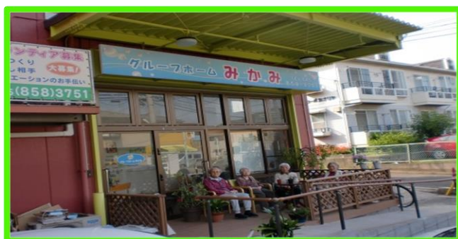
ウッドデッキは利用者さん同志の憩いの場です。