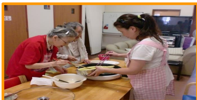
家庭的な雰囲気の中で生活されています。 できることは一緒に行います。