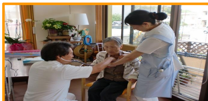
先生がいつでも往診にきてくれるから安心です。