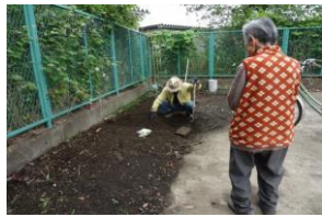
裏のおじさんが畑を作っています。まだ土を耕している最中です。