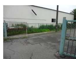
入口には門がついていま