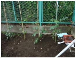
今はトマトだけです。秋に向けて、これからサツマイモを植えるそうです。