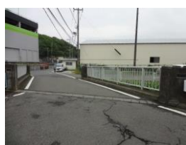
橋を渡って、すぐ右