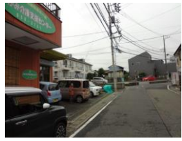
みかみを正面にみて、右方向へ進む。

いつもご家族のご来訪の際には駐車スペースが少なく、ご迷惑をおかけしていましたが、この度徒歩で2分程の場所に駐車場を増設致しました。施設前に駐車できない場合はこちらをご利用ください。