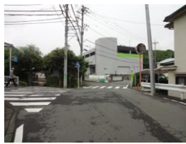
左手に野菜売り場(無人)をみて、直進する。