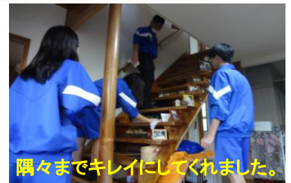
隅々までキレイにしてくれました。