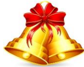
ホントにいいチームです。