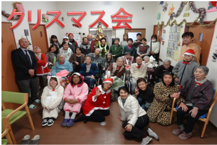
利用者さんからクリスマスプレゼントをいただきました。