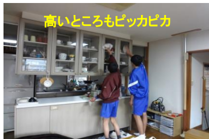
高いところもピッカピカ